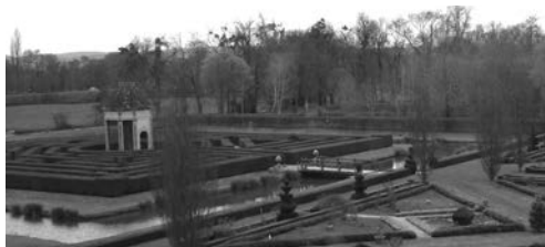
Château de Cormatin

http://lyc58-romain-rolland.ac-dijon.fr/Pedago/HDA/HDA.htm