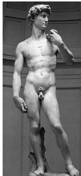
La Renaissance à Florence en trois œuvres, David vu par trois artistes et trois générations : Donatello (1409), Verrocchio (1473-75), Michel-Ange (1504).