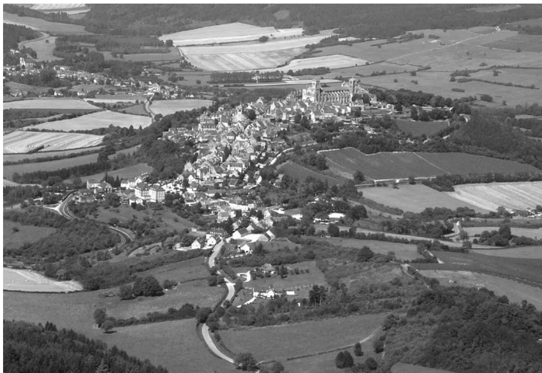
Vezelay - Photo Carl Daniel - http://www.survoldefrance.fr - juillet 2005

Pour repérer les applications réalisées par des collègues, faute de rubrique spécifique, le détour par le « plan du site » est à conseiller. http://tinyurl.com/ac-dijon-planHG