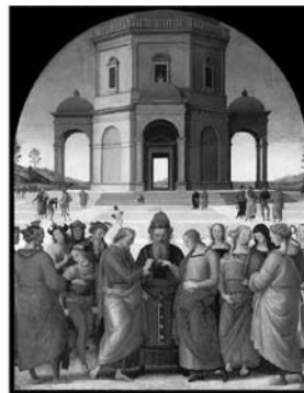
Le Pérugin, Le mariage de la Vierge - 1500-1504