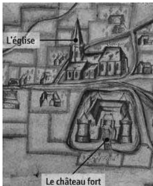
Seigneurie de Wismes - détail - Magnard

Le plan est reproduit dans de très nombreux manuels d'histoire de 5 e (2010). Il était déjà présent en 1997, 2001, 2006, mais plus rarement. Sa diffusion élargie ne met pas en cause la richesse de la documentation des manuels, ni l'énorme travail des auteurs. Elle incite cependant à questionner un choix aussi unanime.