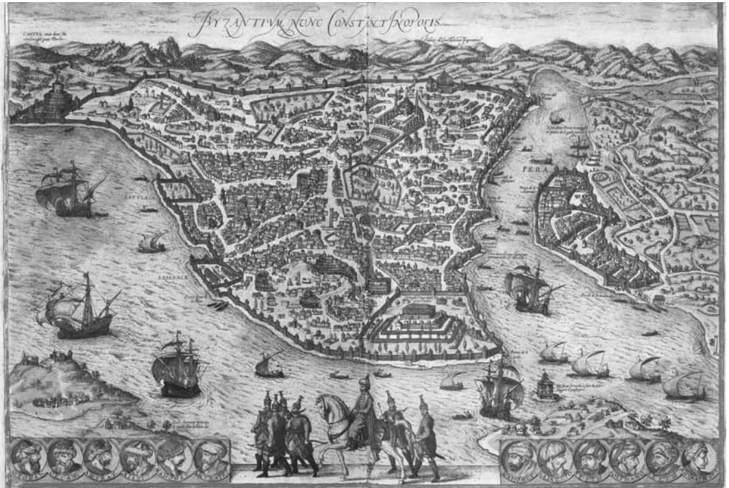
© The Hebrew University of Jerusalem & The Jewish National & University Library

Istanbul, « Byzantium, nunc Constantinopolis » Georg Braun - Franz Hogenberg, Civitates Orbis Terrarum, 151, 1572 http://historic-cities.huji.ac.il/turkey/istanbul/maps/braun_hogenberg_1_51.html