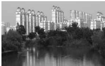
Songjiang est une ville nouvelle au sud-ouest de Shanghai. La photo est prise depuis un quartier résidentiel. Carine Henriot a étudié Songjiang dans sa thèse. Photo Sylvain Kahn 2010

- Plusieurs émissions de France-Culture donnent la parole à des universitaires. C'est le cas de Planète Terre , l'émission de Sylvain Kahn et de son blog Globe pour la géographie .