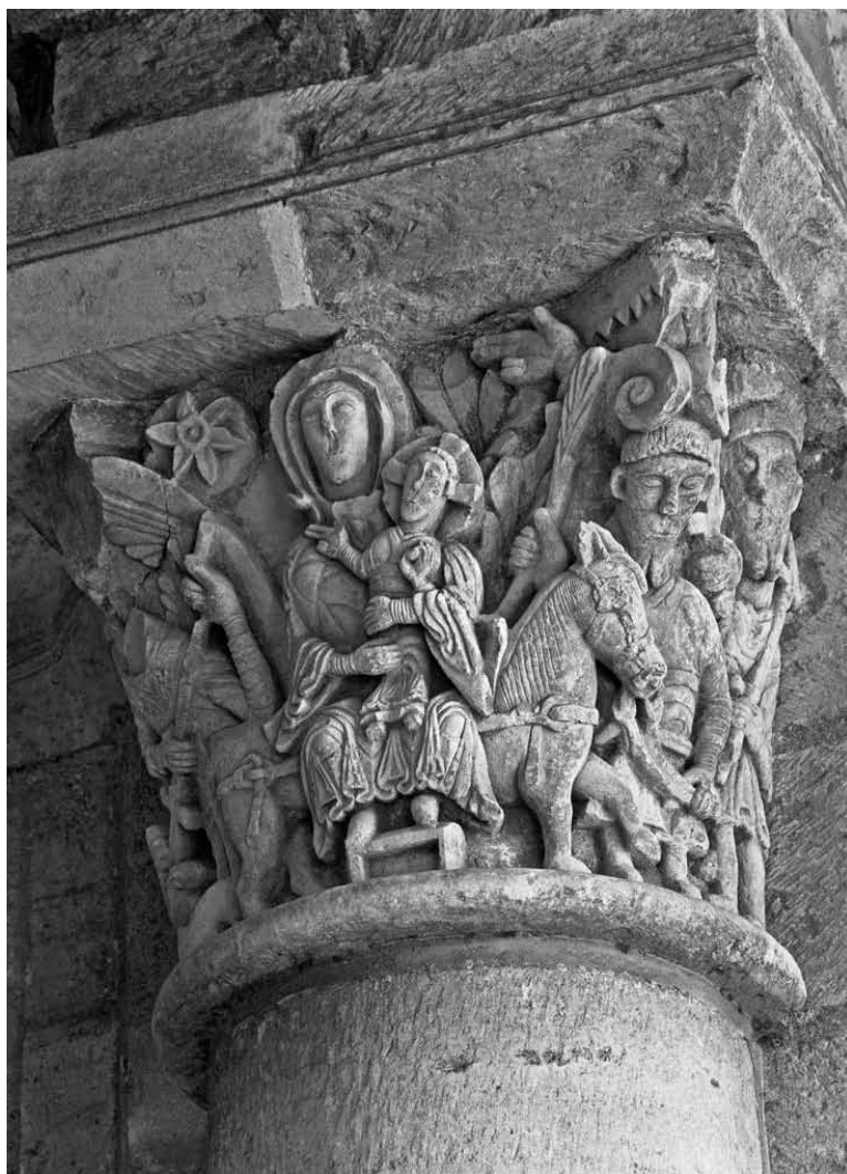
Saint-Benoît-sur-Loire - La fuite en Egypte

Le service éducatif du Loiret propose un dossier pédagogique élaboré par Sylvain Négrier. L'histoire de l'abbaye est présentée à partir d'une quarantaine de documents (textes, photos, cartes) commentés avec soin. On y mesure l'importance de l'abbaye au XI e , son assise régionale et son influence dans la France du Nord, la place du culte des reliques, le rôle des abbés (Abbon, Gauzlin), la rivalité avec l'évêque d'Orléans, les relations avec le roi de France ou avec le pape.