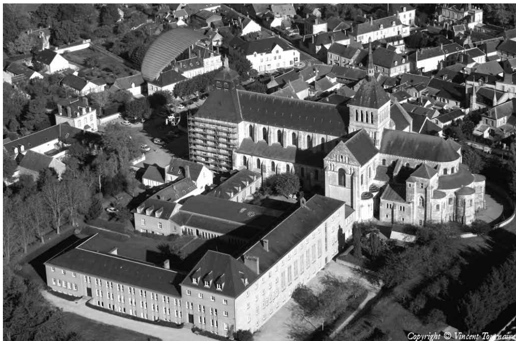
Saint-Benoît-sur-Loire, Vincent Tournaire, Survol de France, 15/10/2007