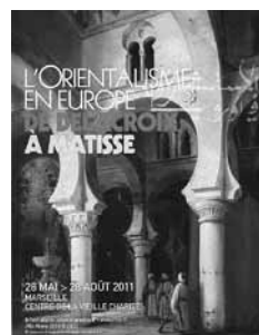
L'orientalisme en Europe.

« Femmes d'Alger dans leur appartement », le chef d'œuvre de Delacroix a été présenté au Salon de 1834. Charles Baudelaire y voit « un petit poème d'intérieur, plein de repos et de silence, encombré de riches étoffes et de brimborions de toilette ». Le site L'histoire par l'image analyse le tableau, rappelle le contexte et propose une interprétation. Les mots clés