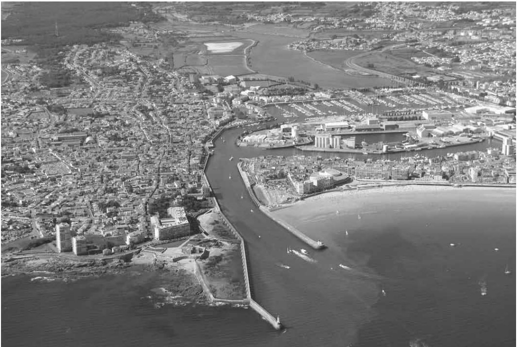
Les Sables d'Olonne - photo Benoît Maremberg - © Survol de France - 05.2010 - http://www.survoldefrance.fr/affichage2.php?&img=33930 - Pour La Rochelle, voir les photos 23984 et 27852