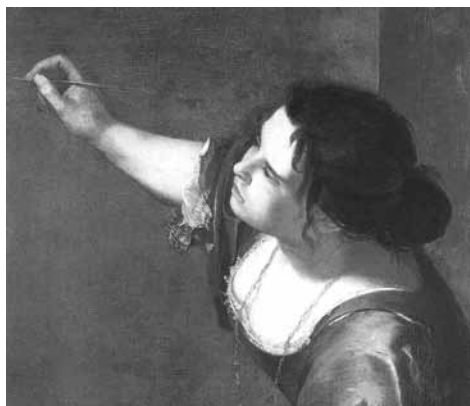
Artemisia Gentileschi - Self-Portrait as the Allegory of Painting (detail) - 1630s Royal Collection, Windsor