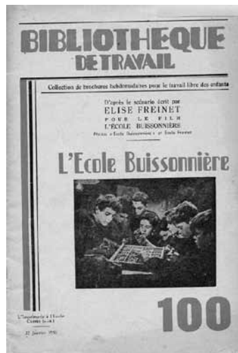
L'Ecole Buissonnière, BT 100 (22.01.1950)