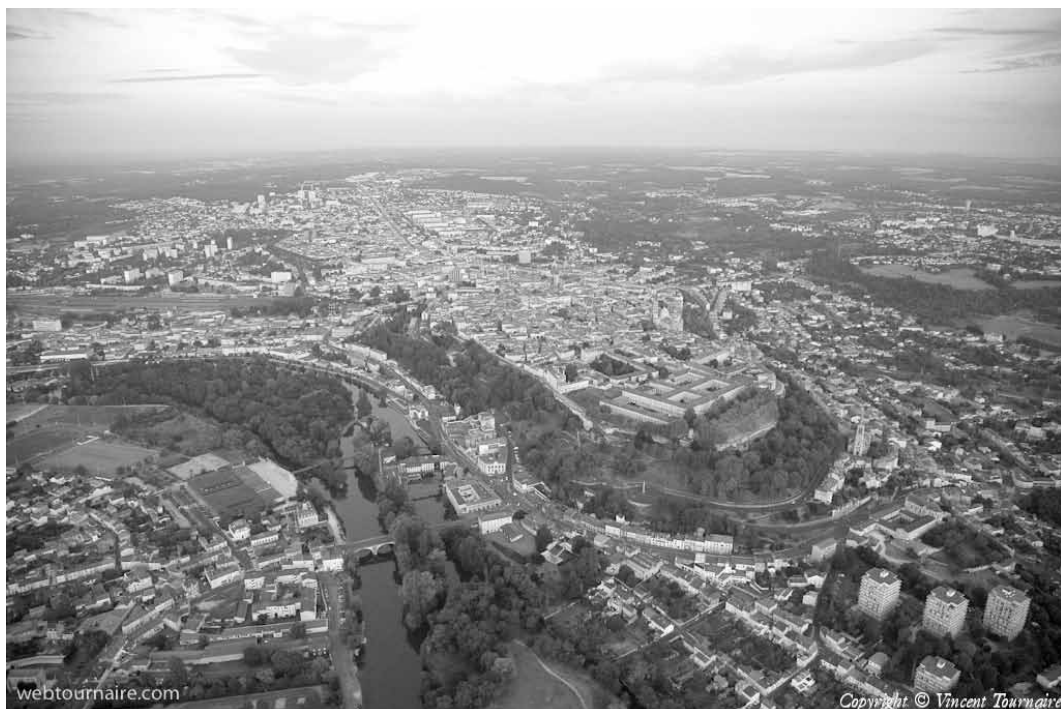
Angoulême, photo Vincent Tournaire - © Survol de France - 14/08/2012 Voir aussi http://webtournaire.com/paramoteur_parapente.htm

En ce moment, Facebook et les réseaux sociaux bouleversent à nouveau la donne. La valorisation des affinités supplante la mesure de l'autorité. La proximité relationnelle entre les internautes détermine la visibilité des informations et occupe une place centrale, indépendante des enjeux du sujet à traiter. Le jugement de valeur occupe souvent plus de place qu'une longue analyse rationnelle. Ce nouvel « écosystème » a des avantages : il a ouvert le numérique à de nouveaux publics, il peut améliorer l'indexation (cf. le +1 ou le like). Il a des défauts : dans ce web de la conversation et du bavardage, toutes les activités numériques sont prises en compte, le privé comme le public, l'anecdotique comme l'essentiel.