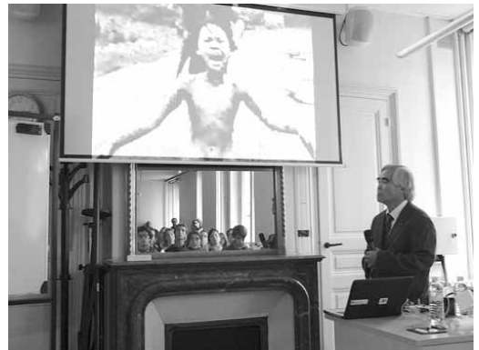
Nick Ut à l'edj de Sciences-Po

http://mappemonde.mgm.fr/num34/internet/int12201.html