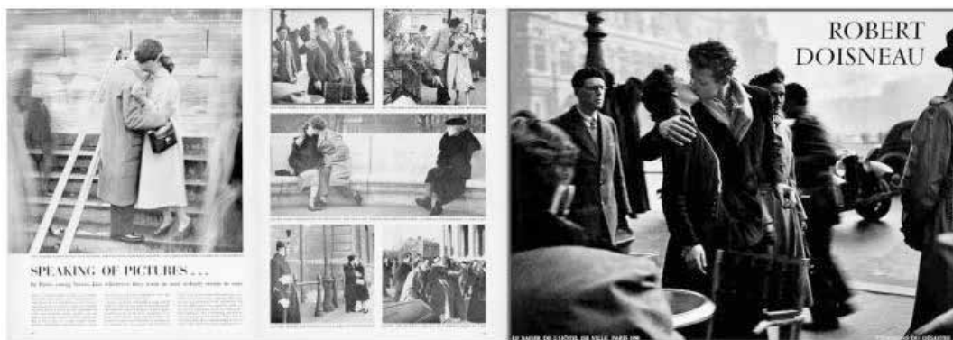
Doisneau, "Le Baiser", première publication dans Life , 1950; poster, 1986.

in André Gunthert, Les icônes du photojournalisme, ou la narration visuelle inavouable - http://culturevisuelle.org/icones/2609