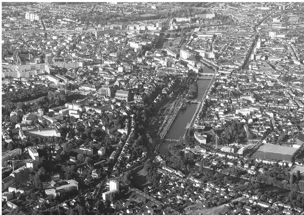
Le Mans