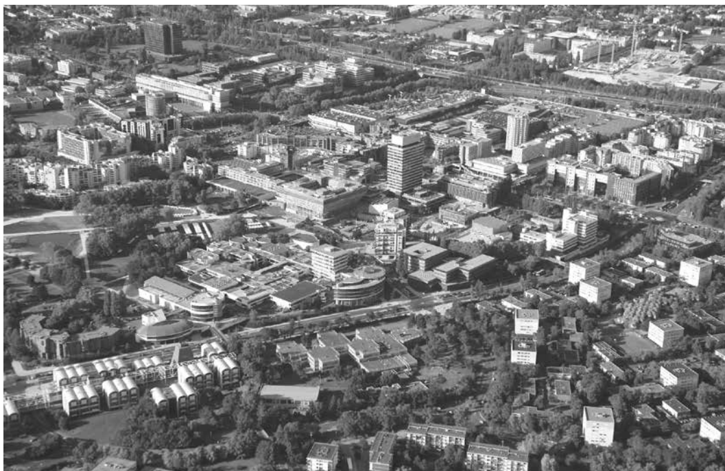
« Cergy préfecture », noyau « historique » de la ville nouvelle, en cours de rénovation.