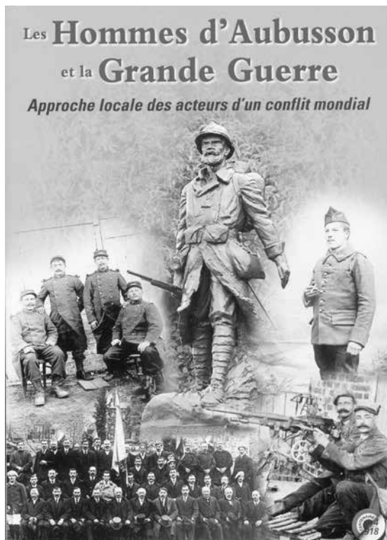
J-C. et J-C. Ruppé, Les hommes d'Aubusson au temps de la Grande Guerre infographie : imprimerie Mouturat (Fliers)

http://clioweb.free.fr/dossiers/14-18/1418.htm