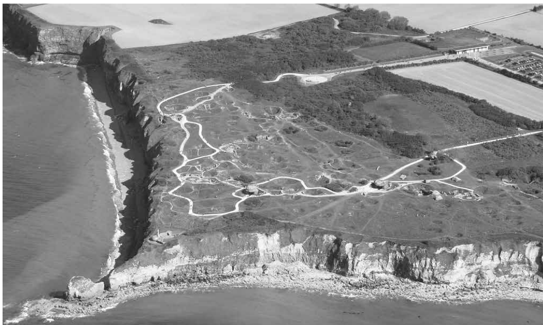
La Pointe du Hoc, 21.05.2009 - http://www.survoldefrance.fr/affichage2.php?&img=23097