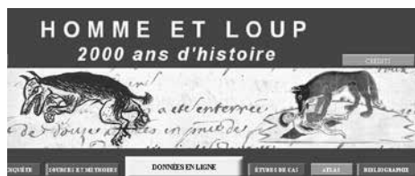
Le site web Homme et loup, 2000 ans d'histoire