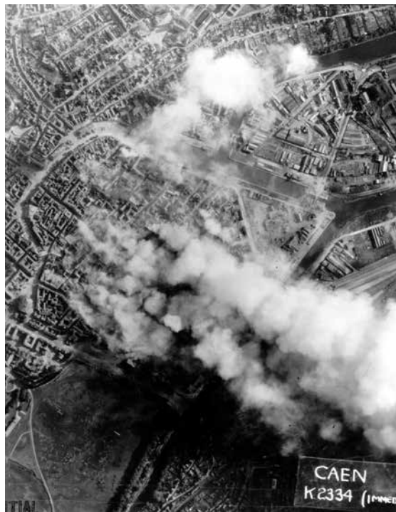
Caen juin 1944

Les médias ont célébré le D-Day en oubliant souvent de le replacer dans le contexte global de la guerre (front russe, guerre du Pacifique). Les historiens en font le départ d'une bataille de Normandie, longue et meurtrière : Caen n'est libéré que le 9 juillet, Saint-Lô le 18 juillet, et Vire, à 80 km du littoral, le 8 août, deux mois après Arromanches, deux semaines avant Paris. Au Mémorial de Caen, un colloque a rappelé que la vision publique du débarquement est davantage influencée par le cinéma (cf. l'exemple du parachutiste de Sainte-Mère-Eglise).