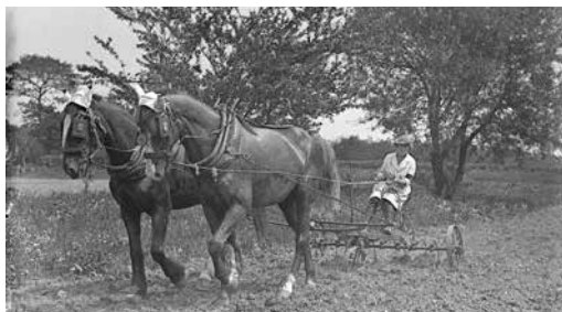
Women's Land Army, Travail de la terre avec un couple de chevaux. IWM-Commons http://en.wikipedia.org/wiki/Women%27s_Land_Army

« L'école n'enseigne pas à voir » affirmait Pierre Rosenberg en 2007. Un détour, avec l'aide du web, par la couverture de l'Abécédaire 14-18 (H&G 427) incite à penser le contraire. Commons reproduit la photo et en indique la source : Lectures pour tous du 15 juillet 1917. Gallica a scanné le magazine qui peut être intégralement consulté en ligne.