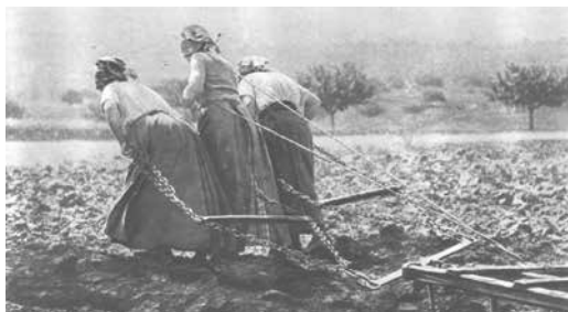
3 robustes paysannes, Lectures pour tous 1917