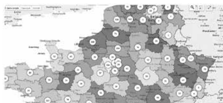
Inventaire des monuments aux morts, Lille 3 (détail) http://monumentsmorts.univ-lille3.fr/cartographie