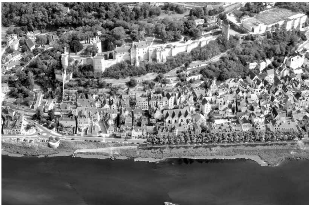
légende : Château de Chinon - - 03.07.2015 http://www.survoldefrance.fr/affichage.php?photographe=Kimy+Tran