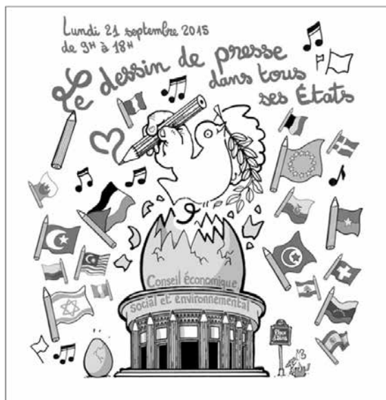
Le dessin de presse dans tous ses états, colloque 21.09.2015 http://www.cartooningforpeace.org/